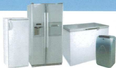
RÉFRIGÉRATEURS / CONGÉLATEURS / CLIMATISEURS