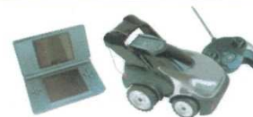
JOUETS / LOISIRS