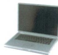
ORDINATEURS PORTABLES / ÉCRANS