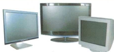
TÉLÉVISEURS / MONITEURS