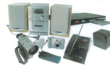
AUDIO / VIDÉO / TÉLÉPHONIE