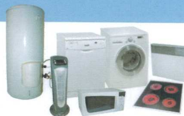
LAVAGE / CUISSON / CHAUFFAGE